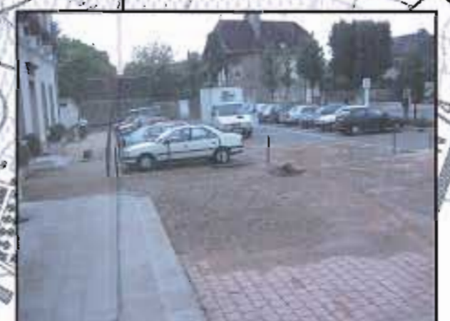
Photo 1 : D'importants ruissellements ont atteint le village, dont la place de la mairie en septembre 2002, suite à un violent orage. 75 mm ont été enregistrés en 45 min à Marsannay.