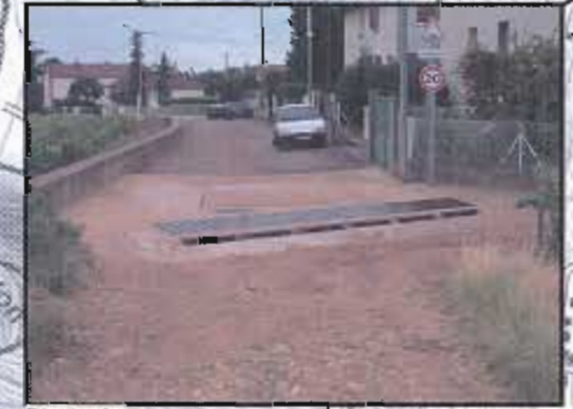
Photo 4 : De nombreux axes préférentiels d'écoulement drainant le vignoble débouchent dans le village. (Ici la rue des Carrières).

Terrain régulièrement inondé. En cas de fort orage, l'eau submerge la rue des Vignes et peut inonder des maisons situées à l'aval. Ce scénario se serait produit vers 1985.