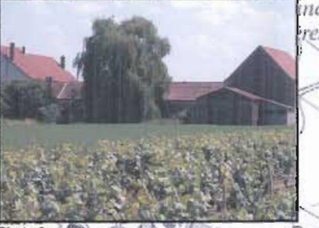
Photo 6 : La ferme et les terrains avoisinants ont été inondés à plusieurs reprises, dont probablement en septembre 2002, par des écoulements provenant du vignoble de Champforey/en Méchalot (entre 20 et 30 cm d'eau au maximum, au niveau de la ferme).