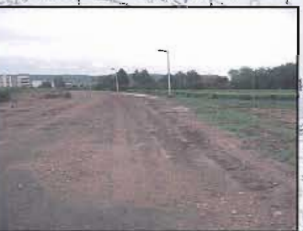
Photo 2 : D'importants ruissellements se sont produits dans le vignoble en septembre 2002, suite à un violent orage (75 mm de précipitation en 45 min à Marsannay), entraînant un lessivage important du sol et de nombreux dépôts sur les voiries. Ici la rue des Vignes a été envahie par les boues.

Terrain régulièrement inondé. En cas de fort orage, l'eau submerge la rue des Vignes et peut inonder des maisons situées à l'aval. Ce scénario se serait produit vers 1985.