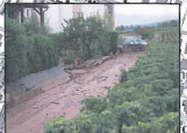
Photo 3 : Le quartier des Portes situé le long de la rue du Carre (RD108) a particulièrement été touché en septembre 2002, suite à un violent orage (75 mm de précipitation en 45 min à Marsannay). Ici, le mur d'une propriété a été renversé suite à une accumulation d'eau à l'amont.