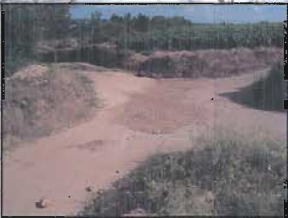
Photo 5 : Un dispositif de bassins d'orage et de chemins profilés a été mis en place pour tenter de maîtriser les ruissellements du vignoble. Ces aménagements fonctionnent efficacement en période de pluviométrie normale. A l'inverse, ils peuvent s'avérer rapidement insuffisants en cas de fort orage tel que celui de septembre 2002. Ici les écoulements peuvent franchir l'aménagement déflecteur sous l'effet de la vitesse.